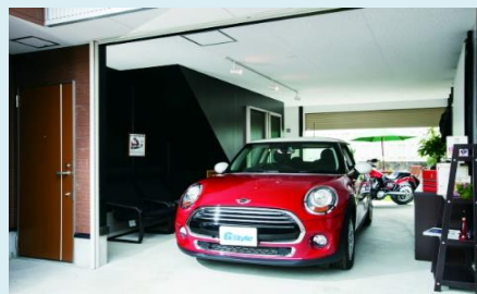
(* 上記写真は施工例。備品等は撮影用)